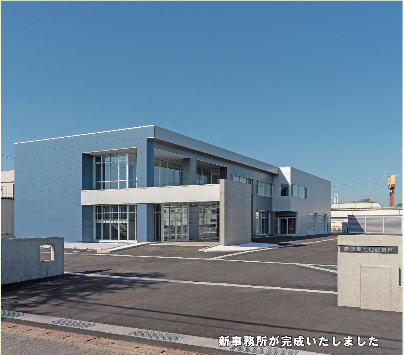
新事務所が完成いたしました